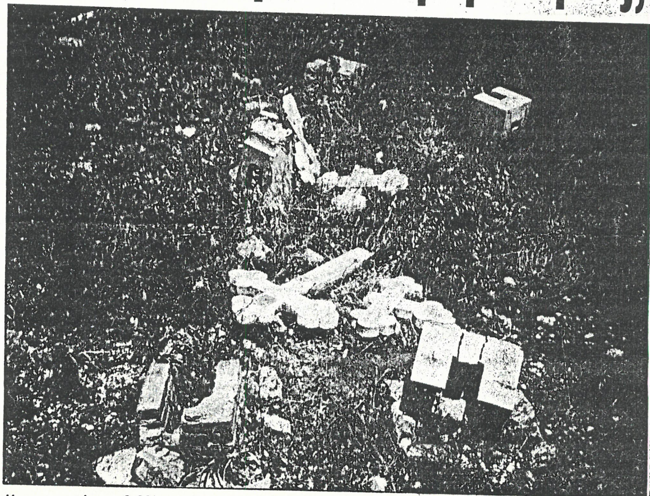
Η καταστροφή και η βεβήλωση είναι εμφανείς στο νεκροταφείο του χωριού Μάνδρες.

• Σε όλους μας που κατοικούμε στη Μ. Βρετανία και των οποίων το πρώτο καθήκον όταν επισκεπτόμαστε στην Κύπρο ήταν να επισκεφθούμε το νεκροταφείο και τους τάφους των αγαπημένων μας και να