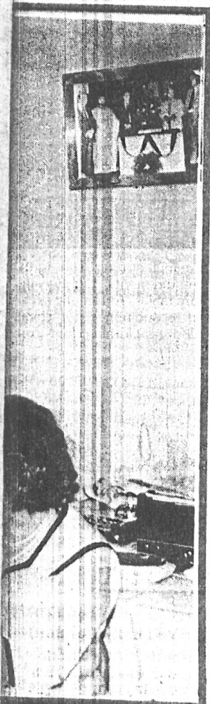
μαρτώνει τον εγγόνο του.