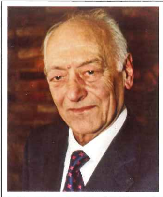
Ο συγγραφέας Σάββας Καραγιάννης